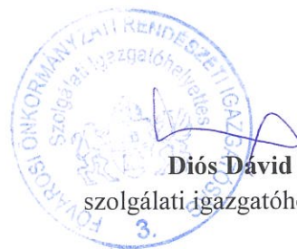
Diós Dávid szolgálati igazgatóhelyettes