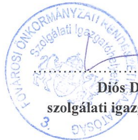
Díós Dávid szolgálati igazgatóhelyettes